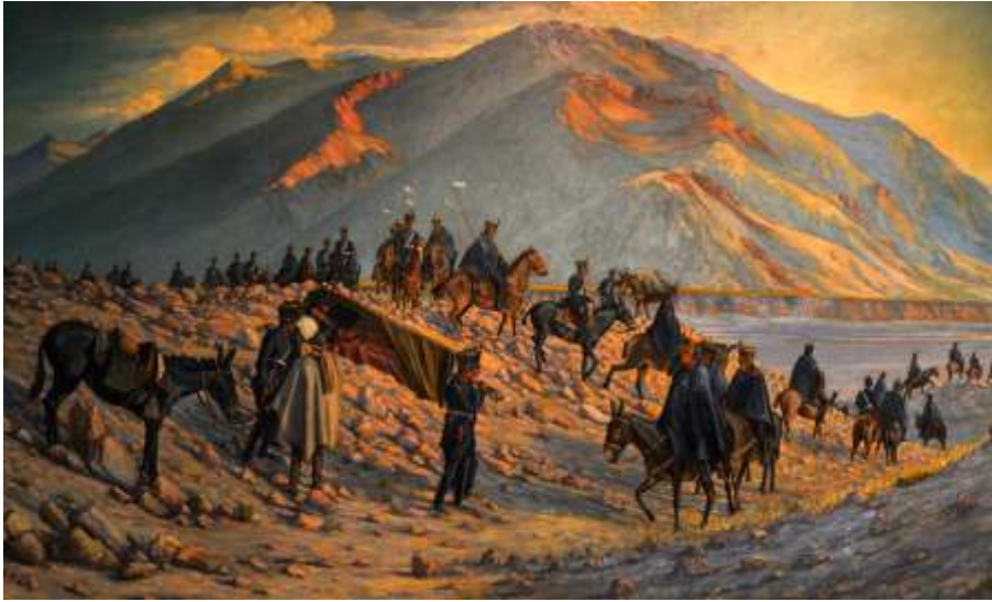
San Martín es transportado a Cauquenes por una compañía de 60 granaderos. Óleo de Fidel Roig Matóns.

soldados cultivaban y cosechaban la comida, las mujeres confeccionaban los uniformes, los carreros ponían sus carretas y mulas a disposición.