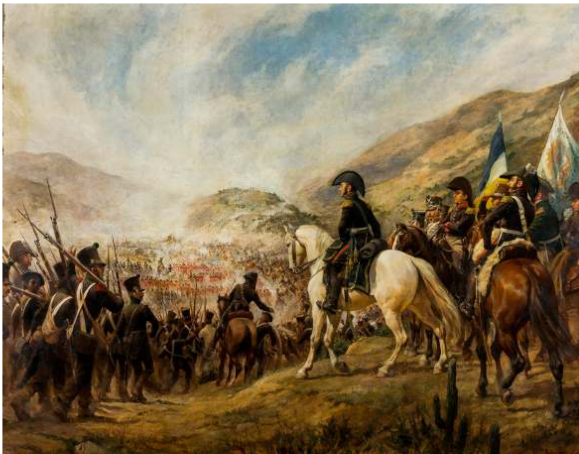
Representación pictórica del Cruce de los Andes por el Ejército de los Andes comandado por el Gral. San Martín